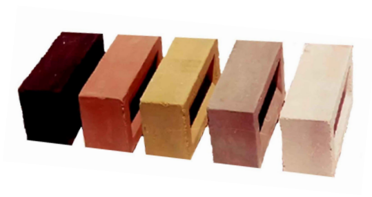
LADRILLOS 250 X 120 X ( 50 – 100 ) mm